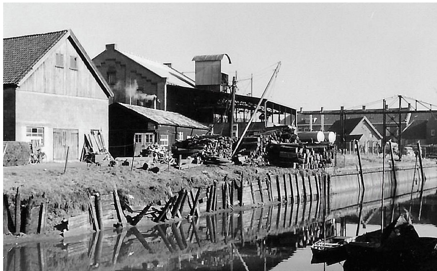
De nieuwe gasfabriek aan de Scheepmakershaven