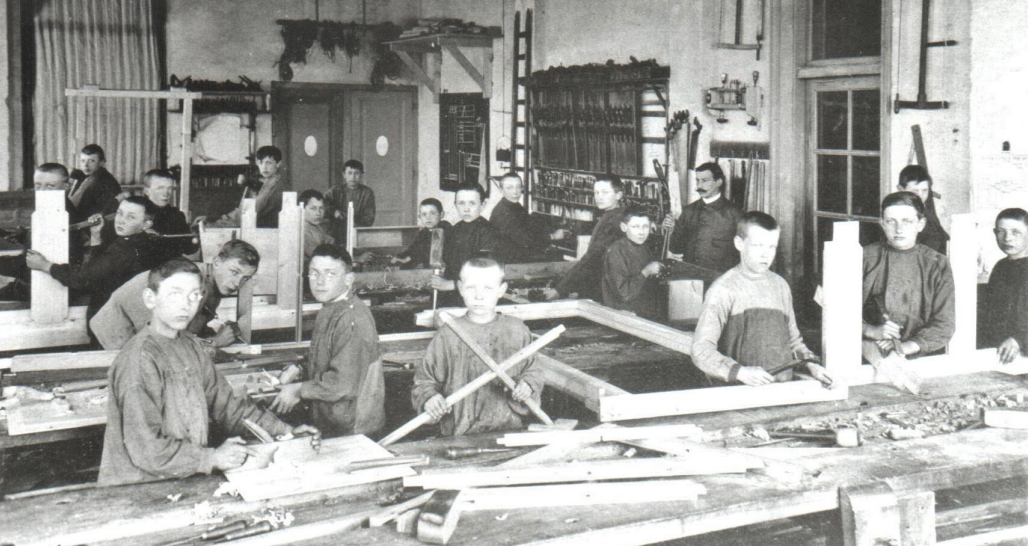
Timmerklas op de ambachtsschool

zers). Er zijn geen verkiezingen voor de Tweede Kamer, wel voor de Provincie (op woensdag 11 april) en voor de gemeenteraad (vermoedelijk op donderdag 17 mei; helaas kan ik daar geen bevestiging van vinden).