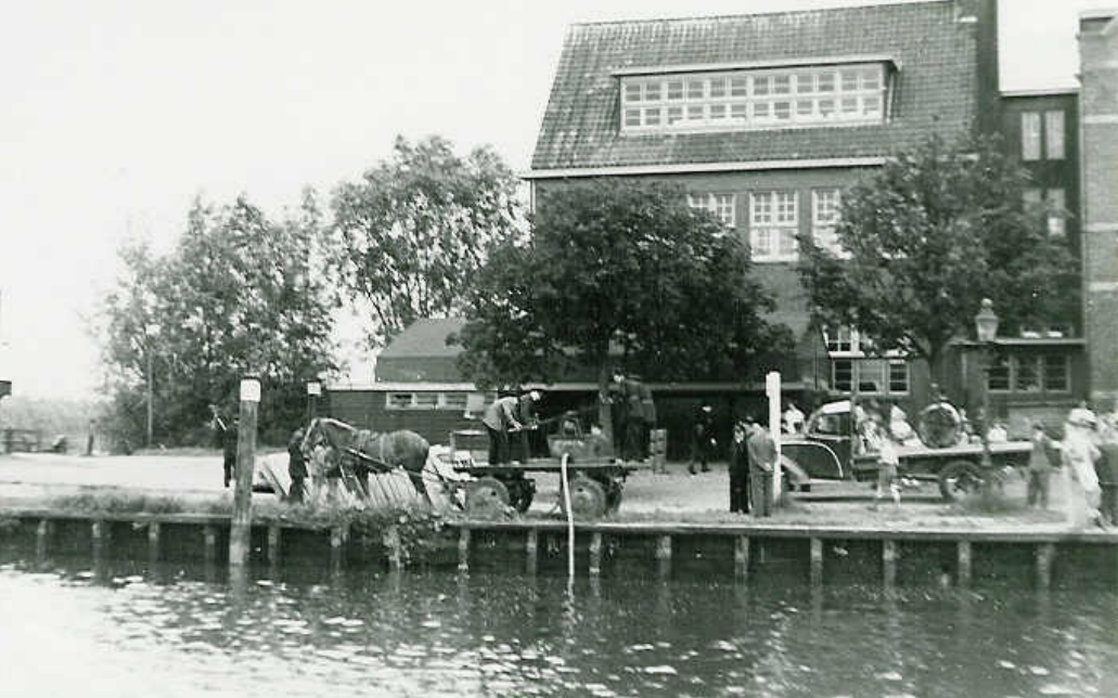
Oostkade bij de oude Ambachtschool

De heer Hoogenboom zegt dat hij niet gezegd heeft, dat spuit No.2 ongeschikt is; die spuit is nog niet zoo slecht, als men er maar mee kan omgaan; de spuit is van oude constructie, men heeft een kwartier werk eer zij water geeft, het zit hem in de zuigers en de kurken zijn uitgedroogd, indien men er water in gooit dan zwellen zij dicht. Jacob Weeda kon er indertijd zeer goed mee omgaan.