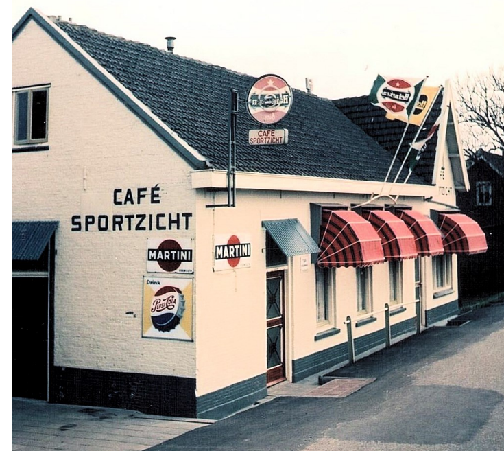
Café Sportzich aan de Oud-Beijerlandsedijk

Toen tegenover de sportvelden van SHO, nu de wijk 'Even Buiten'