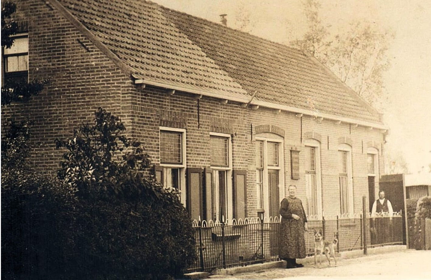
Links boven: Het café aan de Zinkweg 204, foto uit 1930