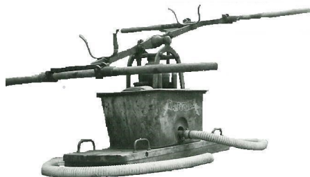
Handbrandspuiten 17 Bas de Koning