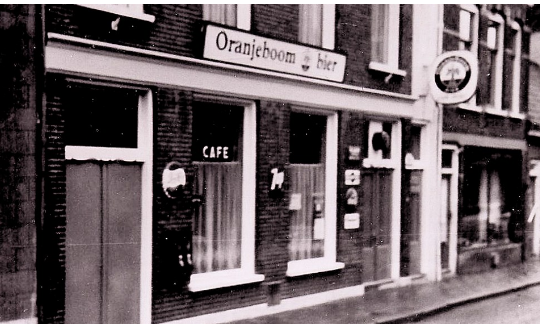
Links onder: Het café aan de Molendijk 47, foto uit 1973