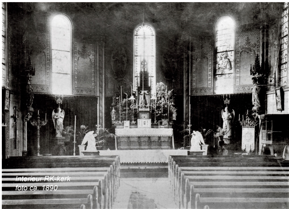
Interieur RK-kerk foto ca. 1890

De Rooms-katholieken in Oud-Beijerland vieren op 1 augustus dat er nu al 100 jaar weer missen gelezen mogen worden in het dorp (daarvoor gebeurde dat in Rhoon). Daartoe is versiering en een erepoort aangebracht bij de kerk aan het Zandpad. Van 4 tot 12 augustus is er een Feest-Missie.