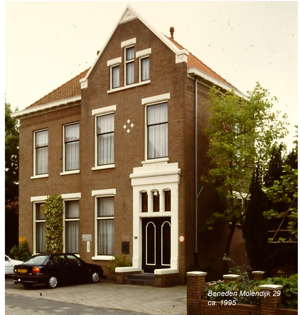
Beneden Molendijk 29 ca. 1995