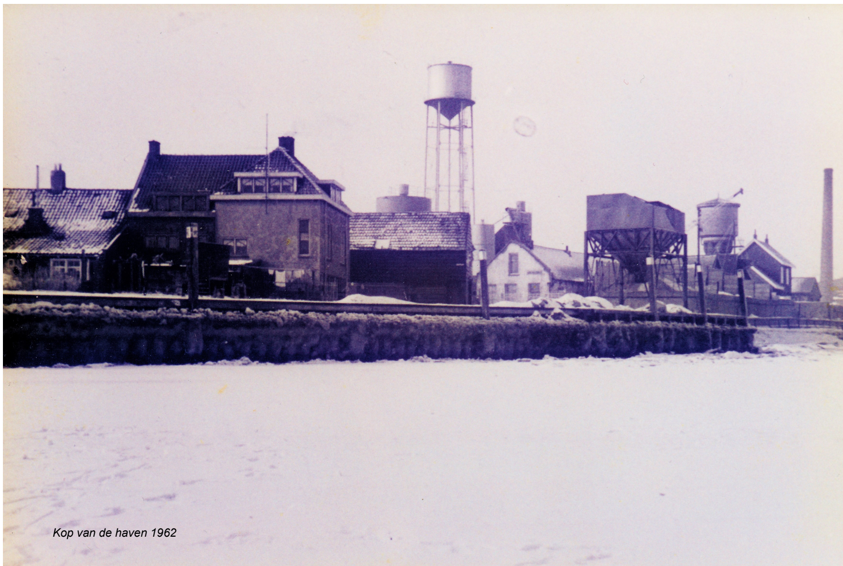
Kop van de haven 1962

met een brander van de loodgieter de koppelingen verhit en razendsnel losgemaakt.