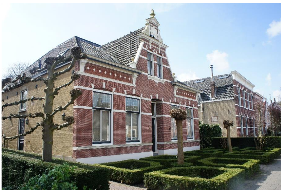
Steenenstraat 14, foto ca. 2020.

Steenenstraat 14 , (eerder huisnummer 10).