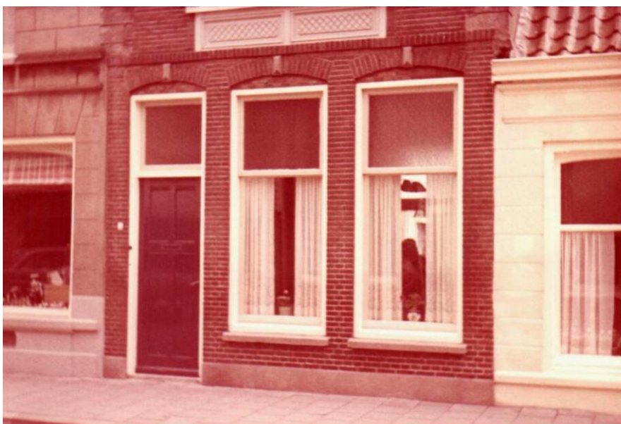
Molendijk 33 afgebroken, foto ca. 1950.