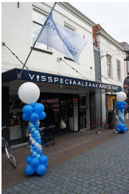
Molendijk 20 foto 2015.