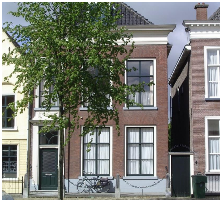
West-Voorstraat 11 foto 2017.