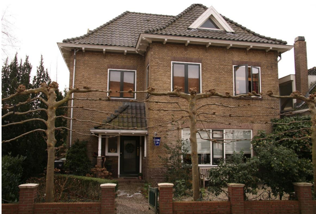
Beneden Molendijk 31, foto ca. 2010.