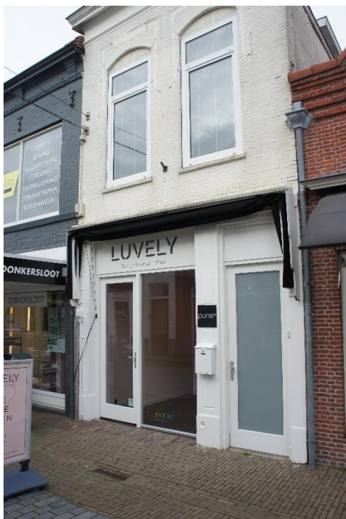
Molendijk 34 foto 2020.