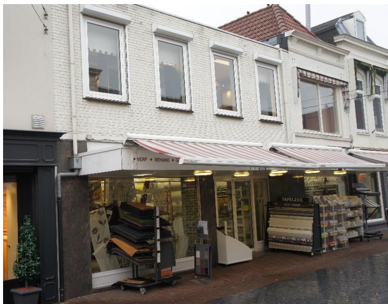
links het verbouwde pand Molendijk 40.

Witte pand in het midden zoals bewoond door Jacob van den Berg.