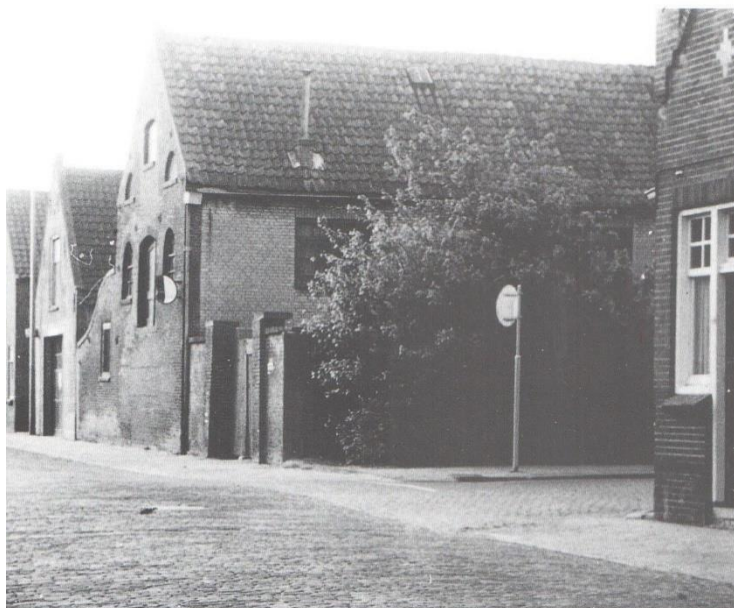
de huidenzouterij, Ooststraat 68.