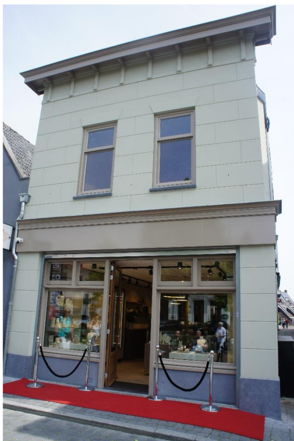
Oost- Voorstraat 33. foto 2024.