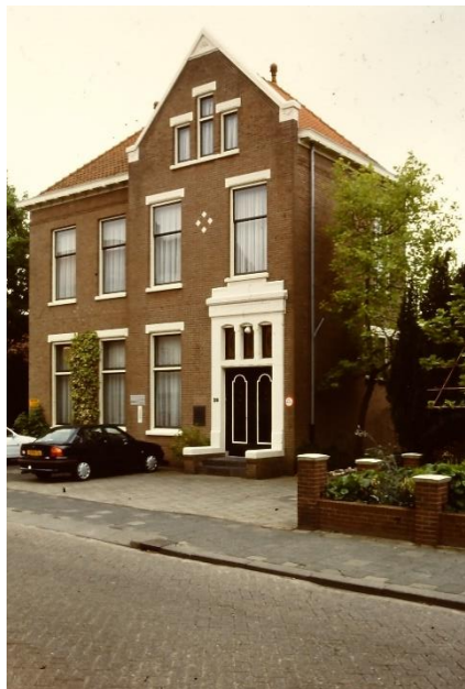
Beneden Molendijk 29 eerder no. 27. foto ca.1995.