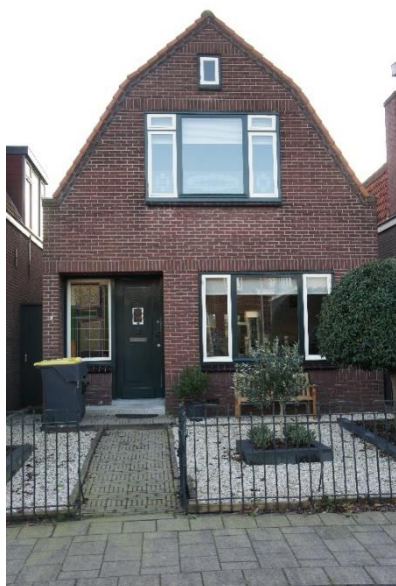
Adm. de Ruyterstraat 63, eerder Polderstraat 63. foto 2018.