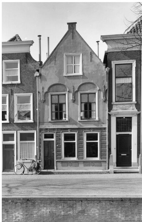
West- Voorstraat 12. foto ca. 1960.