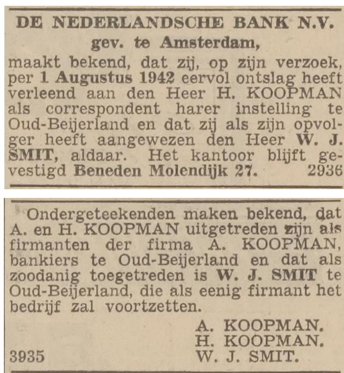
De twee advertenties in het Nieuwsblad voor de Hoeksche Waard, 4 augustus 1942.

In het Nieuwsblad voor de Hoeksche Waard van 4 augustus 1942 verschijnen twee advertenties.