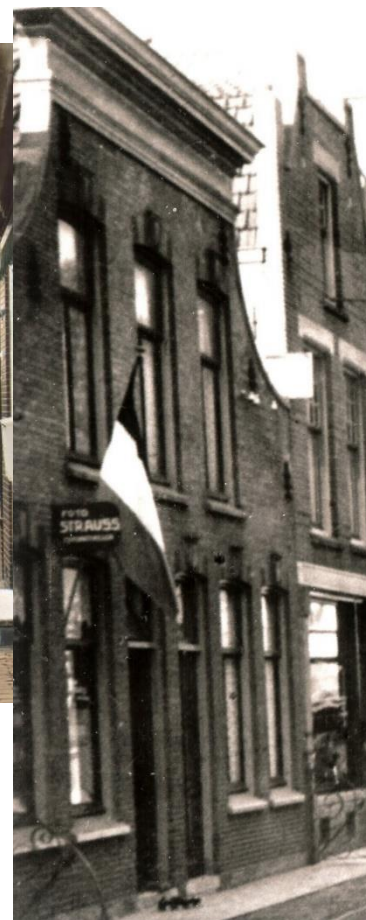
Het pand heeft twee voordeuren. foto 1937.