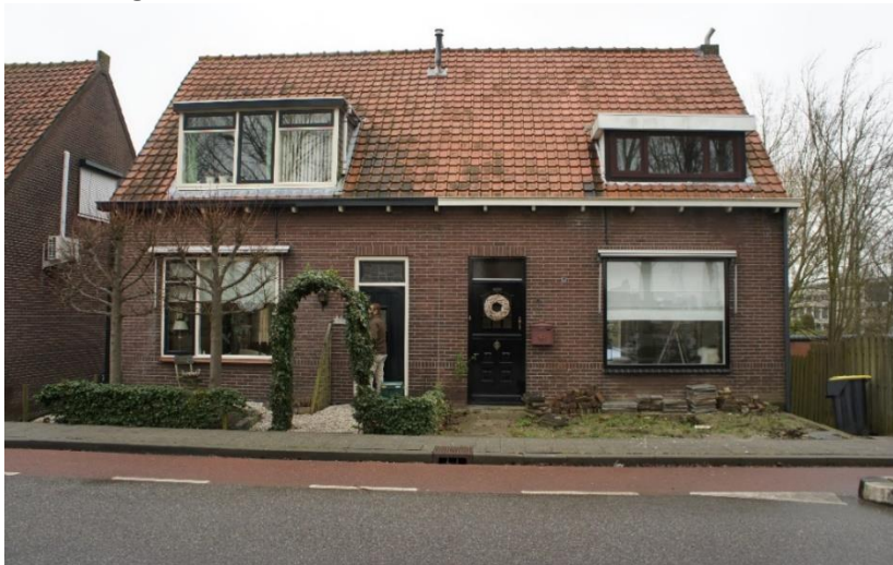
Zinkweg 126 en rechts 125 foto 2018

Deze panden zijn in 1937 gebouwd in opdracht van de kapper Maarten Maris van Eijsden uit Heerjansdam. Waarschijnlijk vanaf de nieuwbouw in huur bij de op 6 januari 1883 in Leeuwarden geboren lompenshandelaar Hessel Frenkel. Hij is op 24 juni 1926 in Middelharnis getrouwd met de op 16 juni 1886 in 's-Gravenhage geboren Dina Kanis.