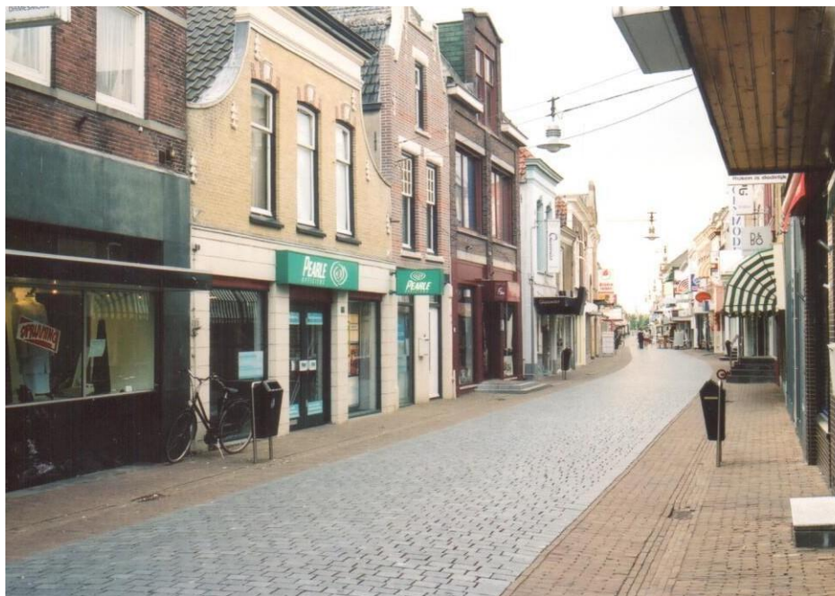
Oostdijk 32, foto 2003.